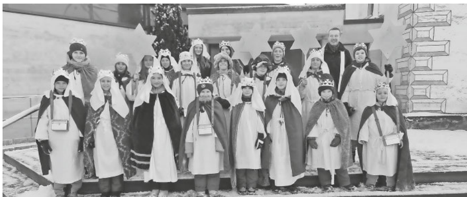
Die Klufterner Sternsingerkinder 2026

Vielen herzlichen Dank an alle Spenderinnen und Spender, die die Kinder und Jugendlichen herzlich an der Haustür empfangen und die Spendenkassen großzügig mit einer Geldspende gefüllt haben und auch an alle, die ihre Spende direkt in den Pfarrbüros abgegeben haben. Ein herzliches Danke an alle kleinen und großen Sternsinger, die den Segen in die Häuser gebracht haben und bei Kälte mit ihren Spendenkassen fröhlich und singend unterwegs waren und auch an alle Betreuerinnen und Betreuer, die die Kinder mit Essen und warmen Getränken versorgt haben.