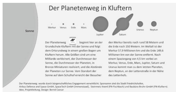
Einstiegstafel in den Planetenweg Kluftern

Der Blick in den Himmel und ins Universum lieferte seit Menschen-gedenken neben der handfesten Wetterprognose immer auch die Gelegenheit zur Interpretation des Weltgeschehens – damals noch astrologisch-mythisch, heute fotografisch-naturwissenschaftlich. Welche Rolle spielt der Mensch und spielen die „Schicksalskräfte“ im Kleinen wie im Globalen? – Einen ersten Schritt hin zu dieser weltumspannenden Sichtweise erleichtert der Planetenweg. Wer bislang nur den Sternenhimmel bestaunte und die Sternschnuppen zählte, kann sich mit Hilfe der Planeten-Modelle eine erste Vorstellung von der schier „unvorstellbaren“ Größe, Gewalt und Dynamik bilden.