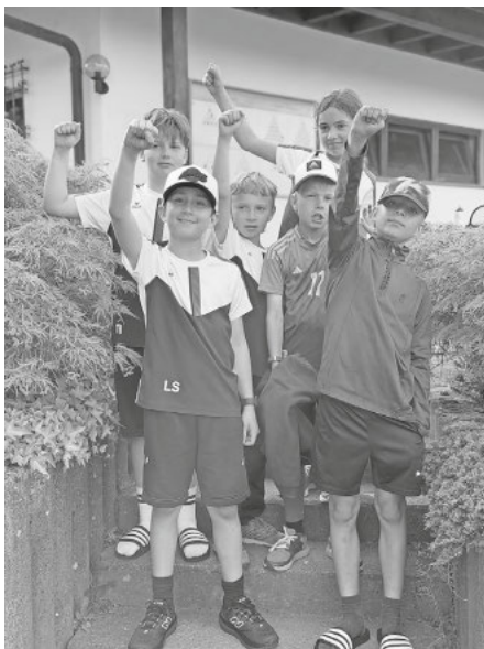
TCK U10 Midcourt Mannschaft