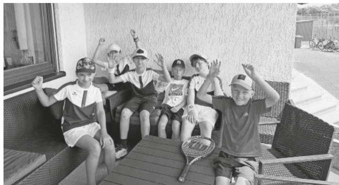
TCK U10 Midcourt Mannschaft